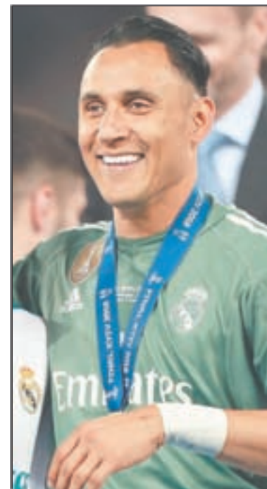
Paris Saint Germain's Keylor Navas.

documental en idioma español, Hombre de Fe, basado en la vida de Keylor.